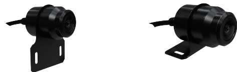
▶ 金屬支架 (平面型)